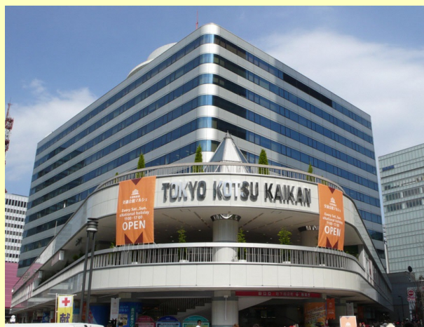
東京交通会館はJR有楽町駅から徒歩1分！