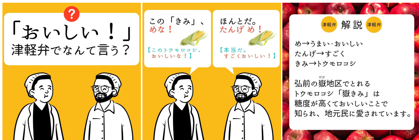
「すぐに使える！ちょこっと津軽弁」のイメージ