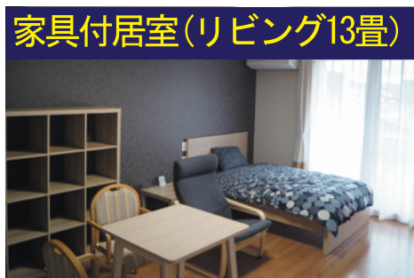
家具付居室(リビング13畳)