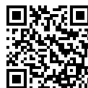
募集説明会 申込フォーム