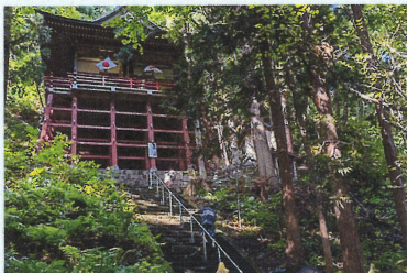
多賀神社。東目屋のシンボル。京都の清水寺を模して造られた