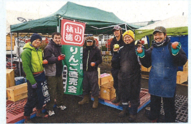
JAつがる弘前青年部・東目屋支部。りんご販売に力を入れる