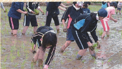
春～東目屋の小中学生らによる田植え

世界自然遺産・白神山地の玄関口とも言える東目屋までは弘前駅から車で約30分。りんごを中心とした一次産業が盛んなエリアです。三十三霊場二番札所として知られる多賀神社（清水観音）や映画のロケ地になるような豊かな自然と四季によって異なる美しい景色があります。