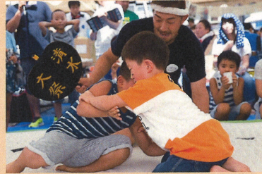
毎年8月に開催される清水大祭では子ども向けの相撲大会を企画