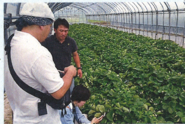
東目屋の農作物を買い付けに関西から訪れる人も！