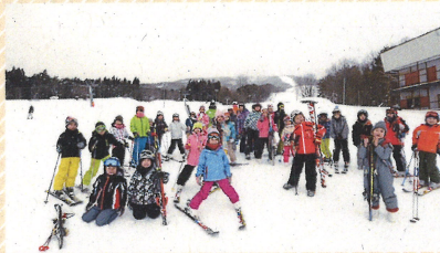
冬～小学生らのスキー教室