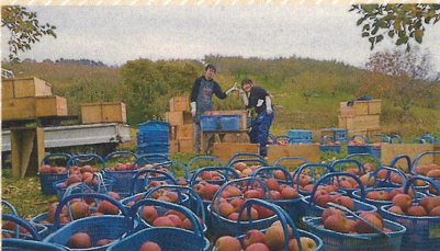
秋～収穫に地元農家らは忙しくなる