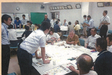
東目屋の魅力を確認するために行ったワークショップ