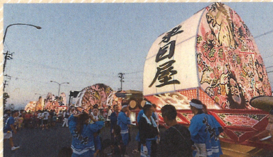
夏～毎年弘前ねぶたの合同運行に参加