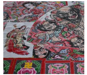
<平成28年度のねぷた>

この他、たくさんのお礼の品から選ぶことができます。申込方法やその他詳細は下記URLからご覧いただけます。 http://www.city.hirosaki.aomori.jp/jouhou/seido/hirosakiouenn-hurusato.html